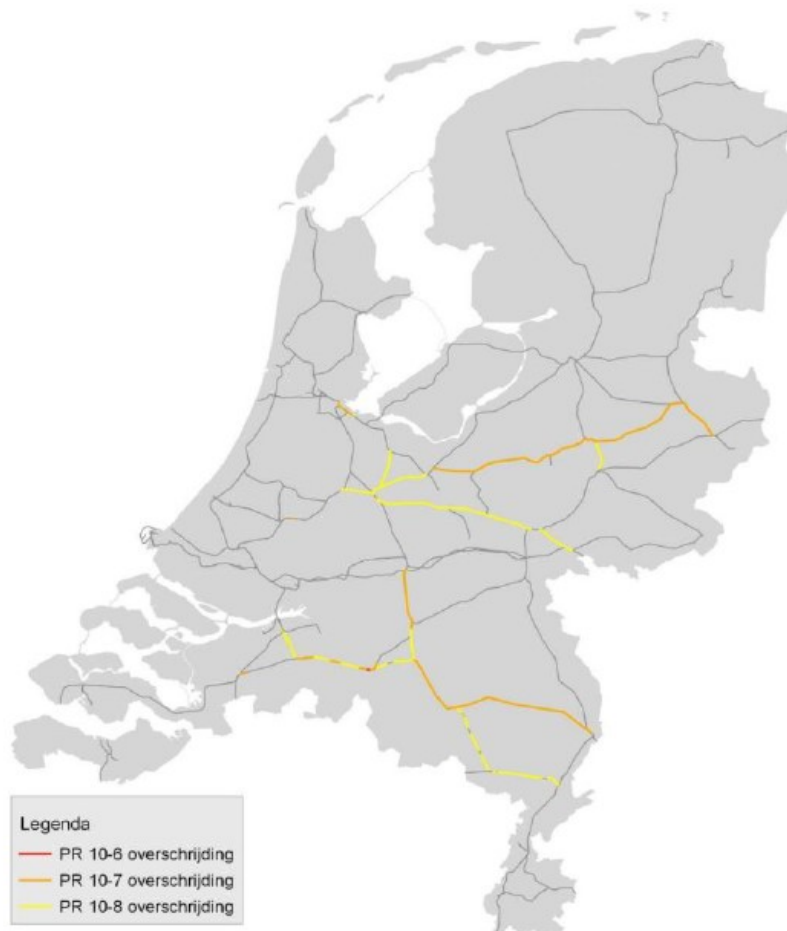
Figuur 1: toetsing van het gerealiseerde transport in 2017 aan de risicoruimte Basisnet Spoor

Men is bezig het basisnet aan te passen en hoogstwaarschijnlijk zullen de normen en dus de aantallen ketelwagons toenemen.